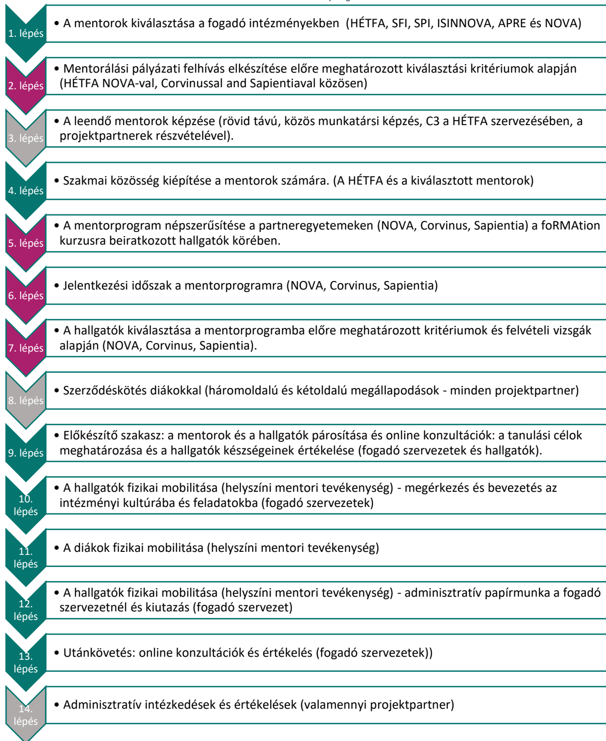
iii. 4. táblázat - A mentorprogram ütemterve

Minden projektpartnernek követnie kell az ütemtervet, még akkor is, ha a fizikai mobilitás kissé eltérő időszakban történik. A vegyes tanulási rész időtartamát a 4.3. fejezet részletezi.