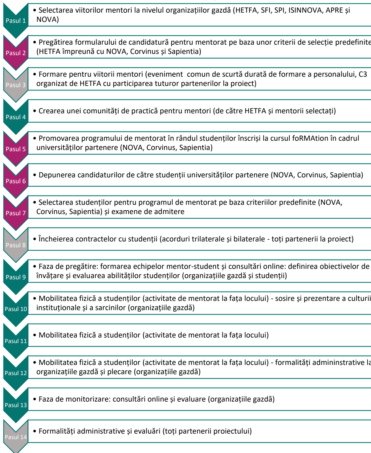
ii. Tabelul 4 - Foaia de parcurs a programului de mentorat

Fiecare partener din proiect trebuie să urmeze foaia de parcurs, chiar dacă mobilitatea fizică poate avea loc într-o perioadă ușor diferită. Durata părții de învățare mixtă este detaliată la 4.3.