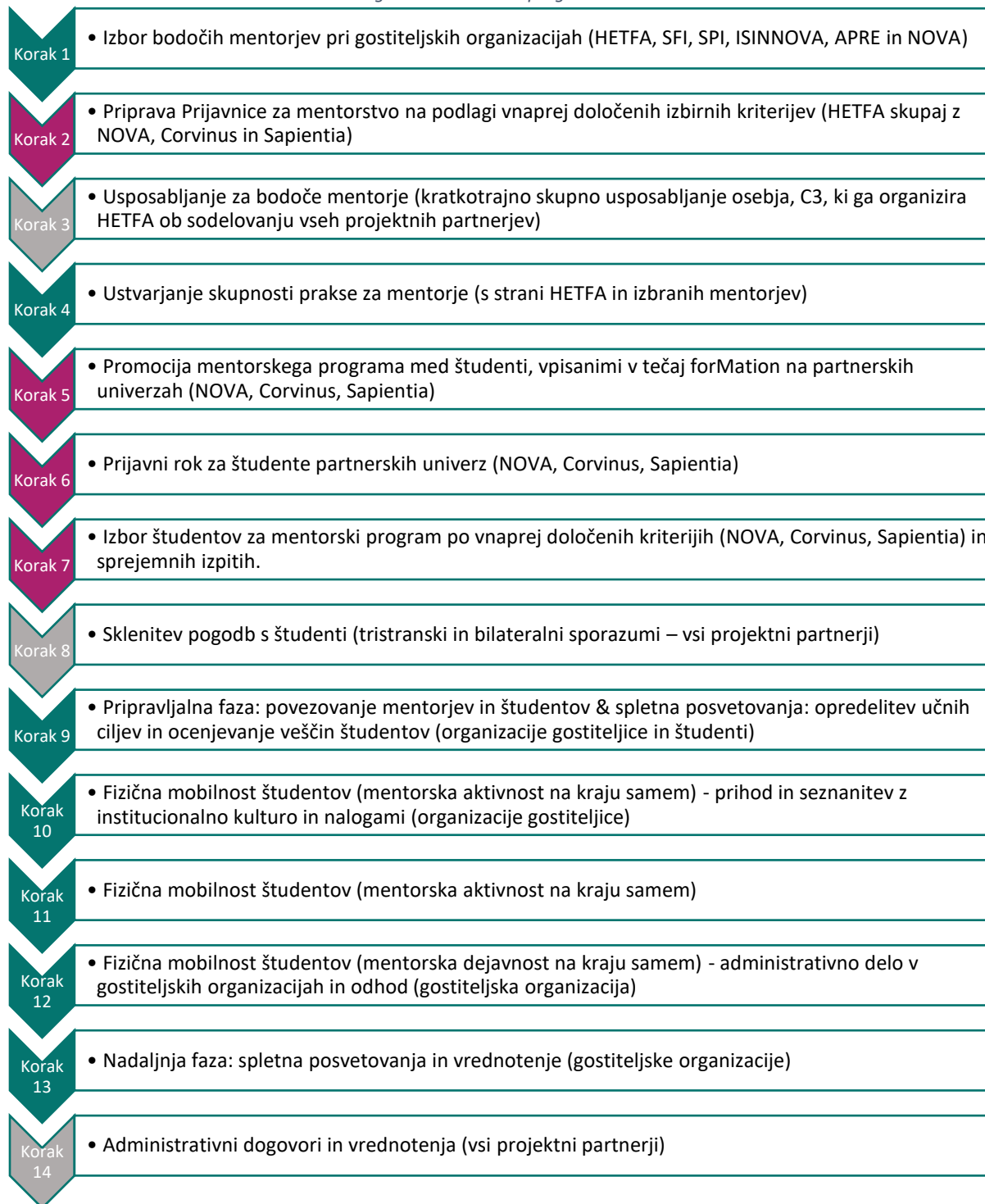
iii. Preglednica 3 – Načrt programa mentorstva

Vsak projektni partner mora slediti načrtu, tudi če bo fizična mobilnost potekala v nekoliko drugačnem obdobju. Dolžina dela mešanega učenja je podrobno opisana v razdelku 4.3.